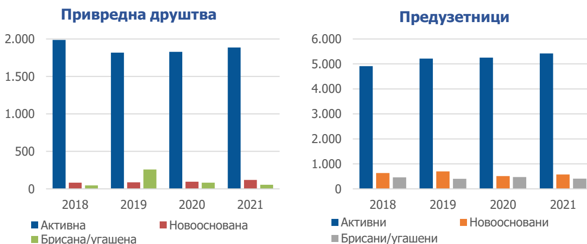
Графикон 1: Број привредних субјеката у граду Чачку