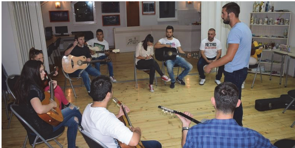
Бесплатне радионице гитаре у Омладинском клубу града