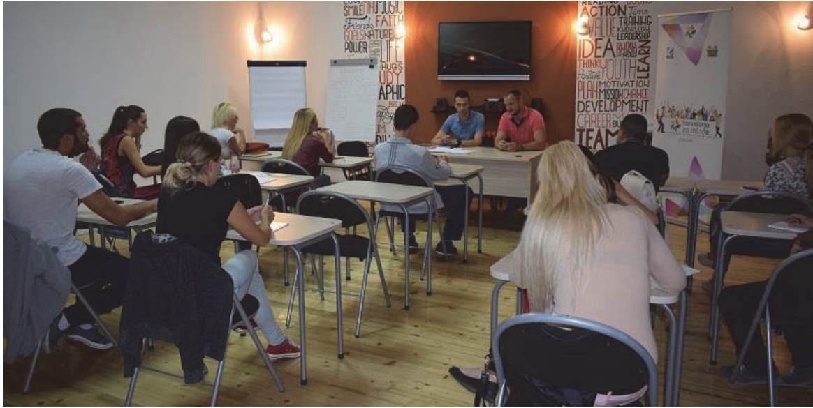
Бесплатне радионице у Омладинском клубу града