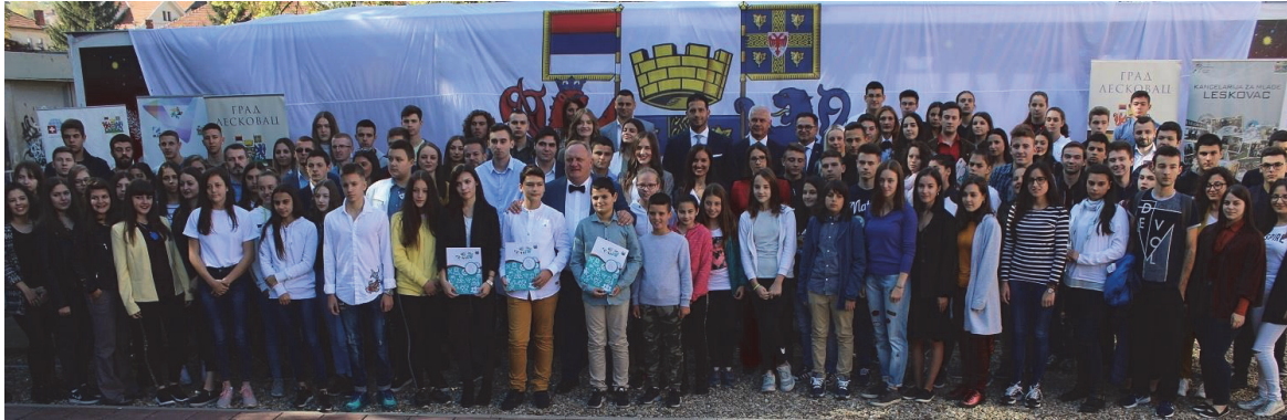
Додела Награда младим талентима 11. Октобра на Дан града

Остварено право на финансијску подршку имају млади таленти до 30 година живота, који су држављани Републике Србије и имају пребивалиште на подручју града Лесковца, који су постигли резултате на различитим такмичењима у области спорта, образовања, културе и уметности, као и студенти са најмањом просечном оценом 9,00 и више у току студирања. Кроз овај систем, град Лесковац преко Канцеларије за младе награђује младе Лесковчане и Лесковчанке за доприносе које постижу из различитих области, а којим се подстиче развој нових научних, културних, спортских, техничко-технолошких и других активности. Такође, након добијене награде, млади имају прилику да своја знања и искуства пренесу другим младима и широј заједници у оквиру предавања и радионица које организује Канцеларија за младе.