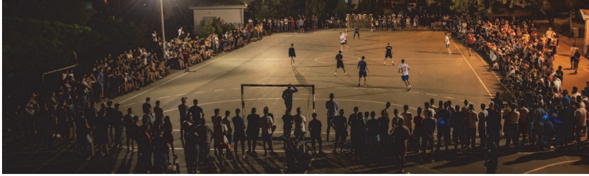
Турнир у малом фудбалу на „Хисару“

Кошаркашки Савез Региона 8, броји 9 кошаркашких клубова на нивоу града, међу којима је најпознатији КК „Здравље“ Лесковац који се такмичи у Првој Кошаркашкој лиги Србије. Клуб се тренутно финансира из буџета града Лесковца. Одлуком Градског већа, КК „Здравље“ и још два спортска клуба, проглашени су за клубове од приоритета и посебног значаја за град што је направило помак у њиховом статусу.