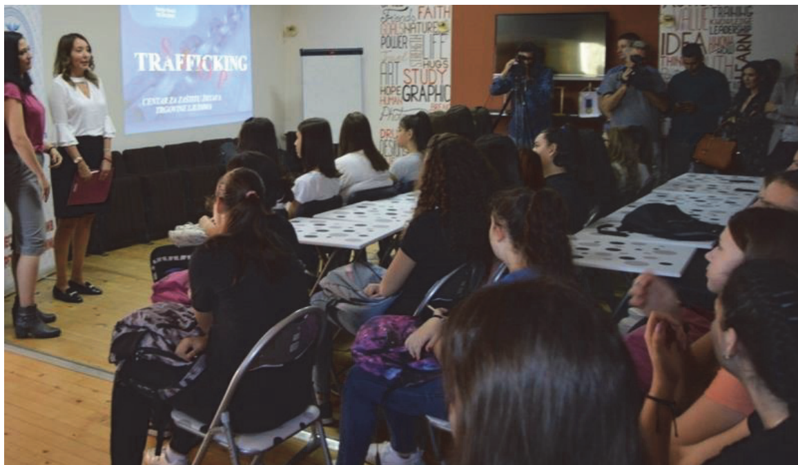
Обележавање Европског дана борбе против трговине људима у Омладинском клубу града

године донело одлуку да се формира „Локални координациони тим за борбу против трговине људима“. Тим је формиран са циљем оснаживања системског партнерства у спровођењу Националне стратегије за борбу против трговине људима који заједнички спроводе Међународна организација за миграције (ИОМ) и Министарство унутрашњих послова Републике Србије.