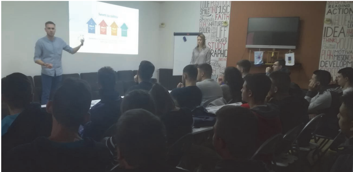
Предавање у Омладинском клубу града на тему „Безбедност на интернету“

Тема безбедности младих задире и у сферу радних односа, у којима се млади третирају као теже запошљива лица, а малолетници појављују као посебно рањива категорија запослених, па стога уживају посебну радноправну заштиту. С тим у вези, вреди нагласити значај безбедности на раду, поготово оног дела омладине који чине малолетна лица. Наиме, домаћи радноправни поредак на систематски и правнополитички сасвим оправдан начин посебну пажњу посвећује регулисању радноправног положаја омладине у односима са послодавцима. Ипак, животна реалност неретко одудара од нормативних стандарда постављених у највишим правним актима, па тако не чуди што се омладина у очима послодаваца види као радна снага према којој није неопходно увек и на сваком месту обезбеђивати услове за безбедан рад. Безбедност на раду младих људи је и те како угрожена у случају њиховог радног ангажовања на тешким физичким пословима, на којима се не води довољно рачуна о стварању безбедних услова за обављање радних дужности. Стога је, чини се, неопходно повећати обавештеност младих људи о њиховим правима на раду, кад је реч о безбедности.