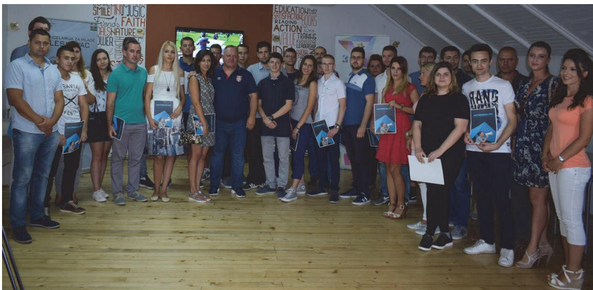
Додела уговора ОЦД у Омладинском клубу града

Како би унапредили услове за волонтирање међу младима и за младе, подржавањем волонтерских активности удружења и школских парламената – ученичких, студентских парламената, Канцеларија за младе града спроводи Конкурсу за финансирање омладинских волонтерских пројеката под називом “Активирај се!”.