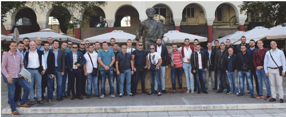
Умрежавање младих привредника Лесковца – Солун посета Министарству Македоније и Тракије

По евиденцији НСЗ-а у априлу 2021. године, број незапослених младих у граду Лесковцу узраста од 20 до 29 година износи 3.266. Број незапослених младих узраста од 15 до 29 година у граду Лесковцу је 3266 што чини 21,97% од укупног броја незапослених на територији града Лесковца. Како су млади садашњост и будућност града, а у структуру незапослених обухватају 21,97% укупног броја незапослених, можемо закључити да је приоритет у омогућавању будућности младих у граду управо повећање шанси за запошљавање. Број младих који чекају на посао је у опадању, с обзиром на то да је у акционом плану до 2020. године тај проценат износио 24,95%, док у 2021. години тај проценат је за 2,98% смањен.