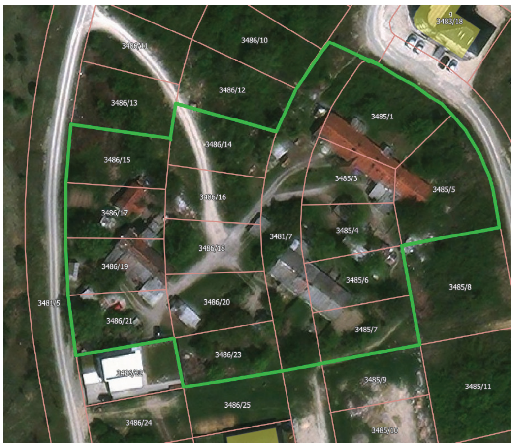
Слика 1 - Орто фото снимак са обележеним катастарским парцелама