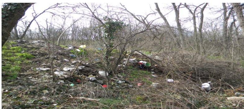
Слика 1. Парк -шумице Бубањ

Уређење парка – шумице Бубањ има за циљ унапређење и очување животне средине, репрезентативнијег изгледа града. За почетак је планирано уклањање дивљих депонија, сеча и уклањања самониклог растинја, болесних и сувих садница по ободу шуме уз улицу Бубањски хероји до “Специјалне школе” и уз улицу Војводе Путника у површини од око 9.250\text{m}^2 (дужина улице \times 10 м од улице по дубини шуме).