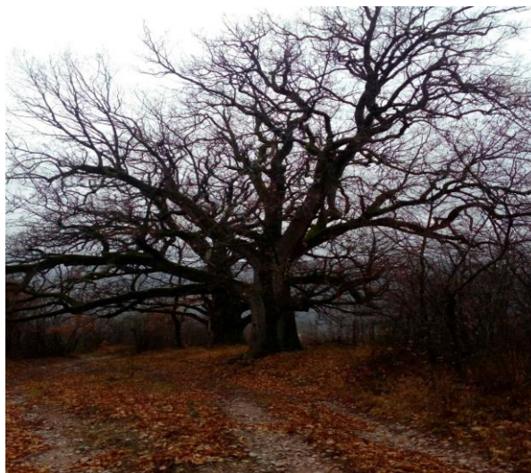
Слика 8: Два стабла крупнолисног медунца

Предвиђени радови за ова два стабла су пре свега постављање табле са натписом, кошење траве, уклањање шибља, уклањање сувих и преломљених грана прунером, као и одвоз покошеног и орезаног материјала.