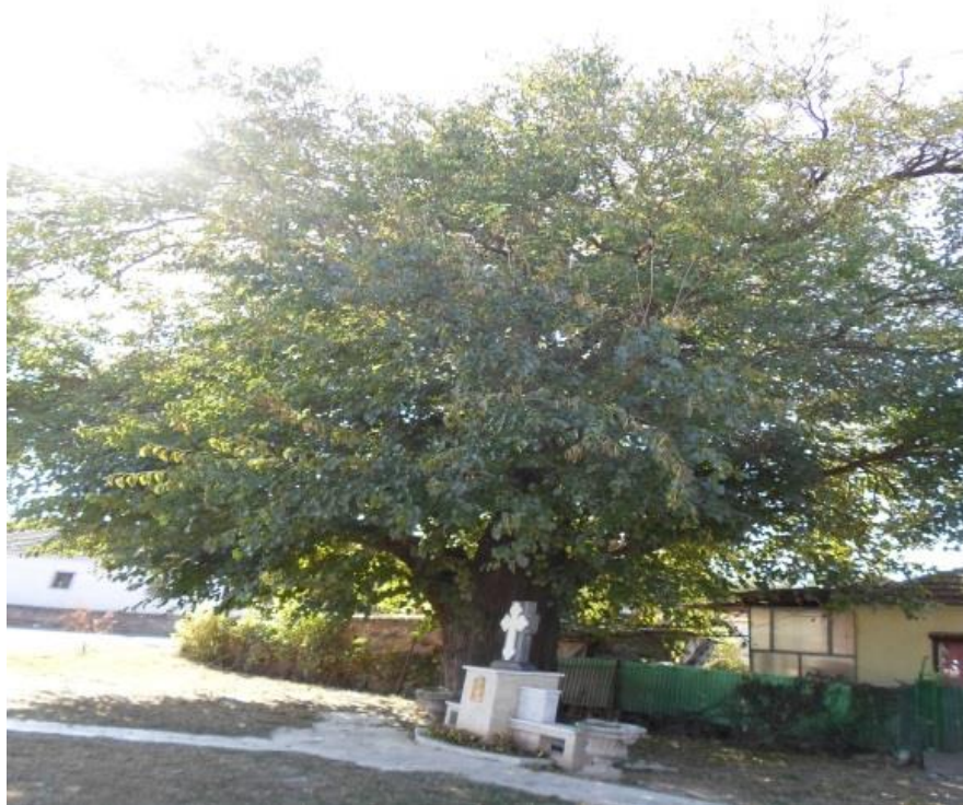
Слика 3: Дуд запис у Медошевцу

За ово стабло потребно је кошење траве испод крошње, уклањање сувих грана из крошње (рад платформе) а пре свега оних грана које расту изнад стамбеног објекта.