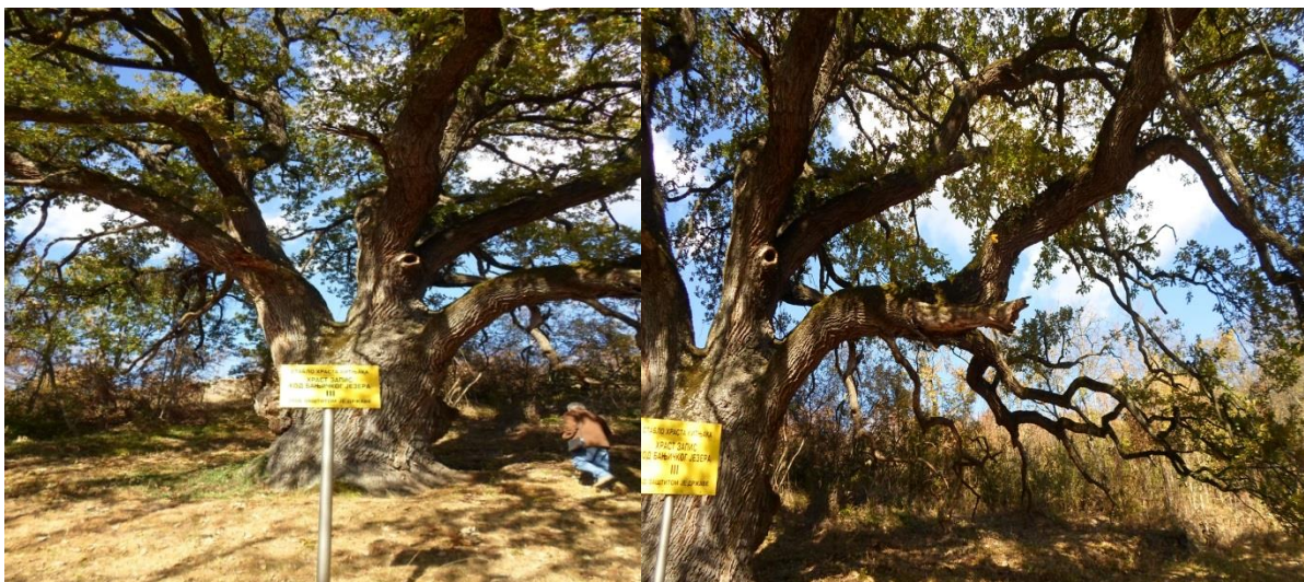
Слика 4: Храст запис код Бањичког језера