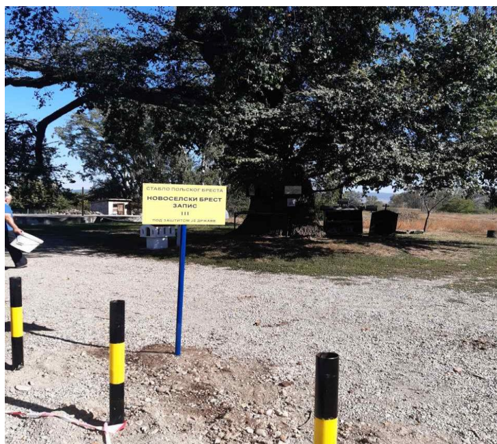
Слика 6: Новоселски брест запис

Подупирачи предвиђени прошлогодишњим Програмом, нису постављени, јер је дошло до неслагања у начину постављања истих између Завода за заштиту природе и управљача ЈКП “Медиане”. Уложена је жалба за промену услова у решењу ЈКП “Медиане” на решење Завода под бр. 29704 од 04.12.2019. године. Уколико ЈКП “Медиана” добије промену услова у решењу у 2020. години, у обавези су да поставе подупираче по цени коју су већ добили од фирме “Елмонт”.