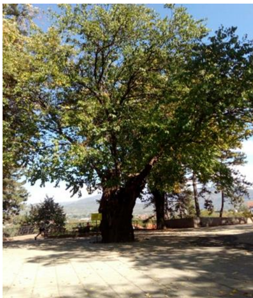
Слика 1: Бели дуд у Нишкој Бањи