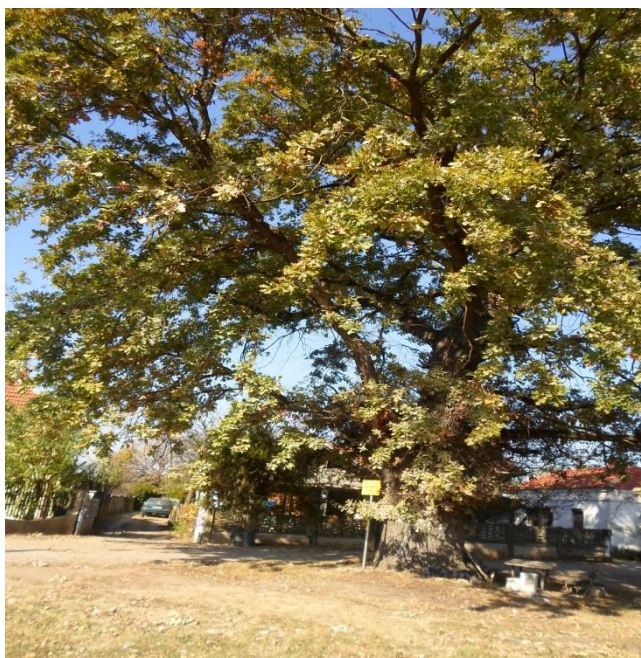
Слика 7: Рајковићев храст

За ову активност неопходно је предвидети и искључење напајања у кабловима у време сече грана.