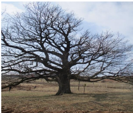
Слика 2: Цер запис у Лесковику

За ово стабло потребно је покосити траву испод крошње, уклањање сувих грана из крошње ( рад платформе) и очистити од палих грана и камења.