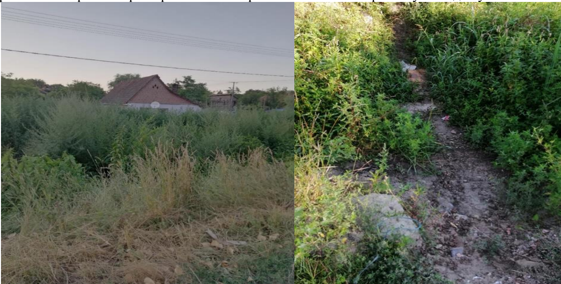
Слике бр. 13 и 14 Зарасло корито реке Чик са барским биљкама и коровом у Халадашу

Рукавац реке Чик је очишћен од отпада и барског биља и то је омогућило бољи оток атмосферске воде из насеља Слике бр. 13 и 14.