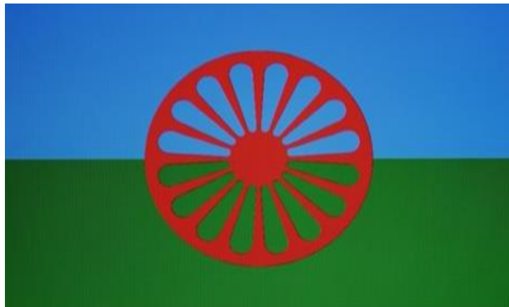
Слика бр. 3 Ромска застава

На ромској застави је плавом бојом представљено небо, као симбол слободе, безграничног пространства и живота под ведрим небом. Зеленом бојом је представљена трава, пут, друм, као симбол живота који је обележен сталним путовањем, на путу без граница који је увек „отворен“ Ромима. Црвени точак са 16 паока представља симбол сталног кретања и живота на точковима.