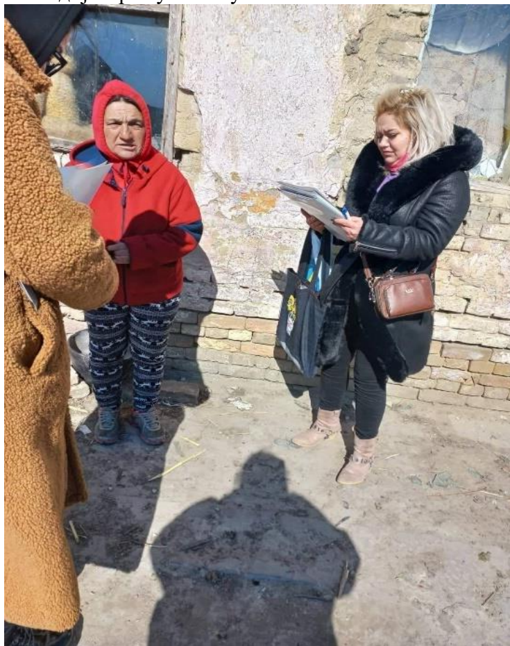
Слика бр. 23 Здравствена медијаторка у насељу

Препоруке испитаника за унапређење здравља ромске популације на територији Града Суботице односе се на: превентиван рад у свим областима и на свим могућим местима (институцијама, организацијама, установама); увођење редовних контрола; организовање фестивала здравља, радионица, предавања, разговора у мањим групама и сл.