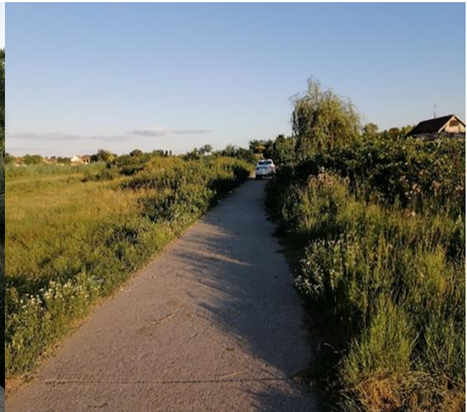
Слике бр.19 и 20 Очишћено насеље Халас од вишегодишњег накупљеног отпада и корова