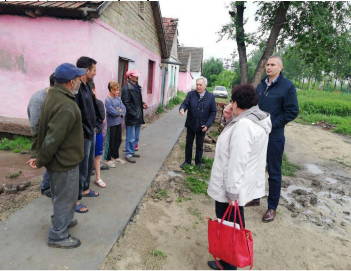
Слика бр. 12 Изграђена пешачка стаза у насељу Халадаш

Рукавац реке Чик је очишћен од отпада и барског биља и то је омогућило бољи оток атмосферске воде из насеља Слике бр. 13 и 14.