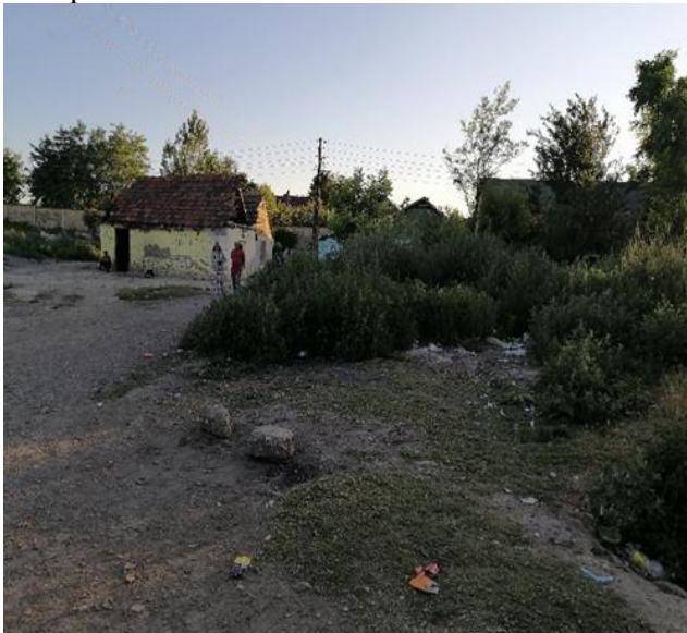
Слике бр.17 и 18 Неочишћен Халас