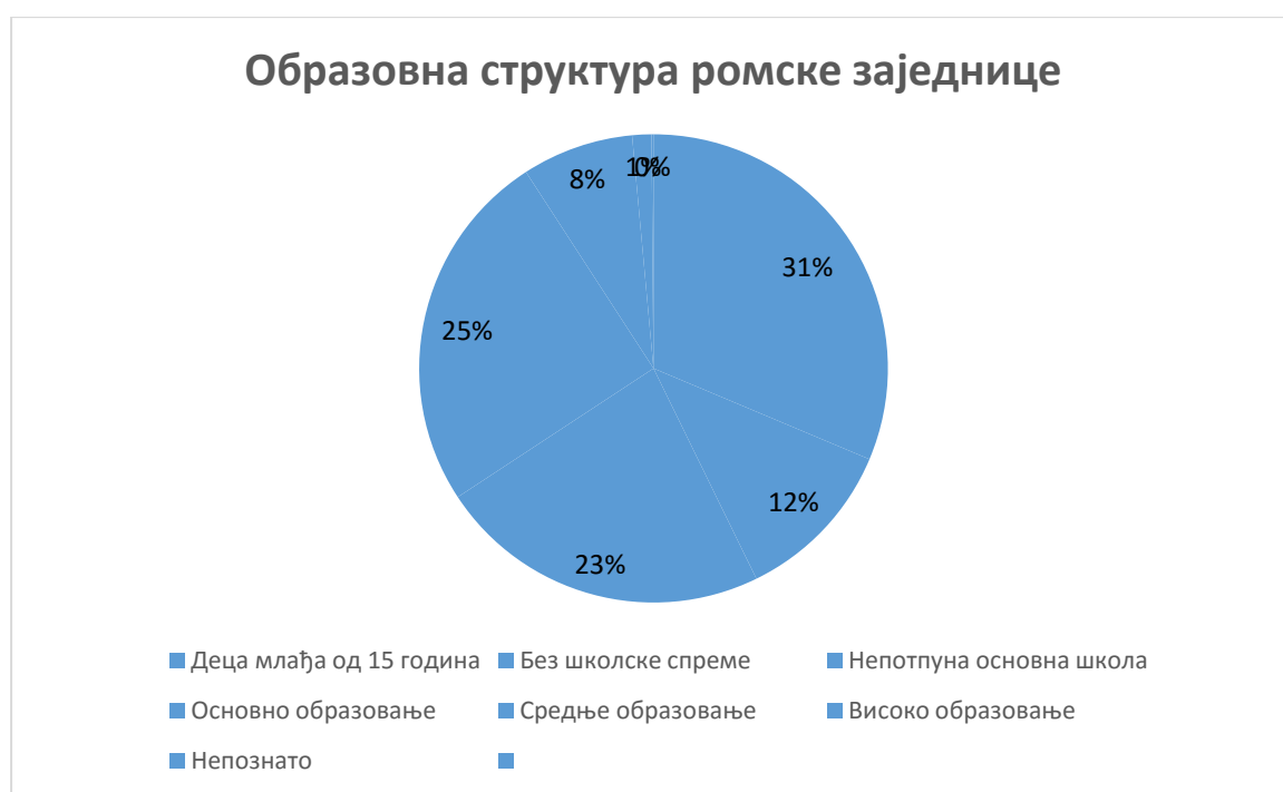
Графикон 1: Образовна структура ромске заједнице града Зајечара ( http://www.inkluzijaroma.stat.gov.rs/sr/zajecar )

Укупно је 48 ученика из ромске заједнице школску 2019/2020. годину похађало основну школу „Ђура Јакшић“, троје деце је похађало припремни предшколски програм. Док је укупно петоро деце од 0-3 година, а двадесет двоје од 3 - 5,5, година.