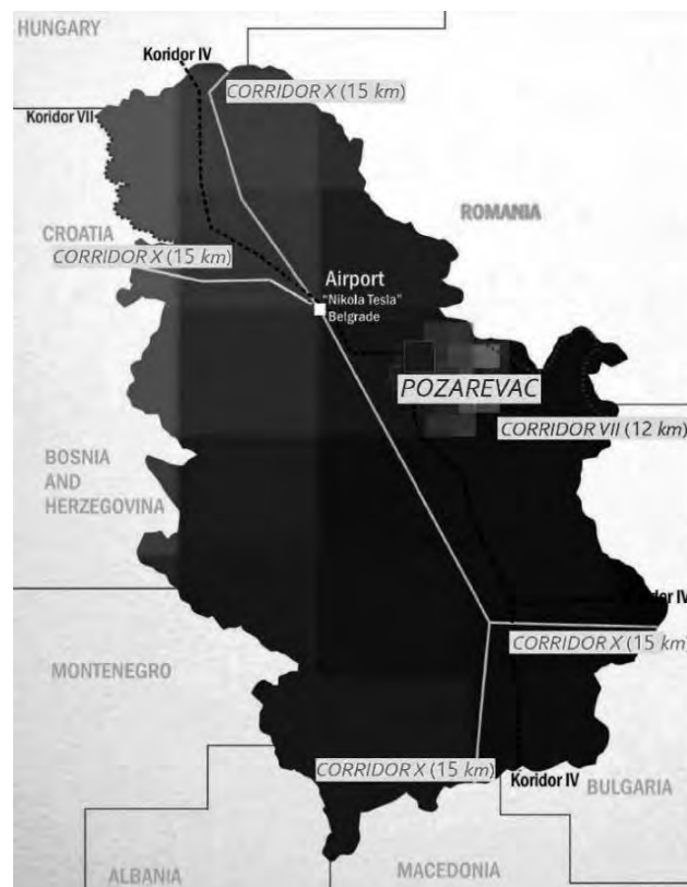
Мапа 1: Географски положај града Пожареваца

Повољан геостратешки положај доприноси томе да Град Пожаревац представља административни, културно-образовни, здравствени, саобраћајни и привредни центар Браничевског округа.