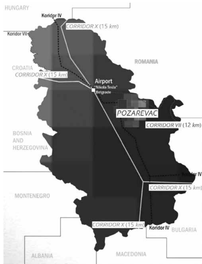
Мапа 1. Географски положај града Пожаревца

Повољан геостратешки положај доприноси томе да Град Пожаревац представља административни, културно-образовни, здравствени, саобраћајни и привредни центар Браничевског округа.