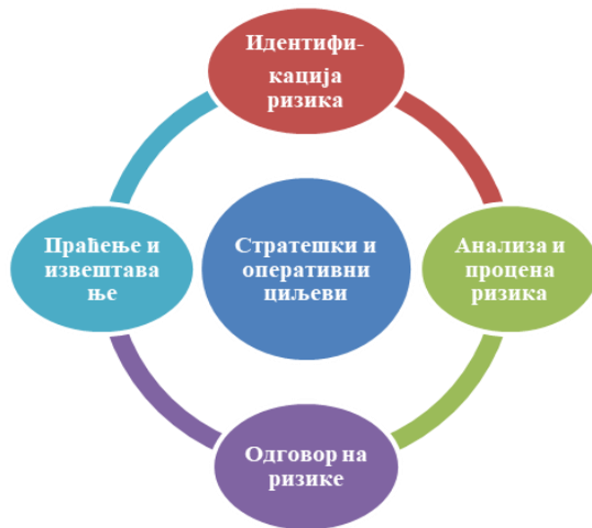
Слика 1. Процес управљања ризицима

Полазна тачка процеса управљања ризицима је одређивање контекста, што подразумева и јасно дефинисање и разумевање стратешких и оперативних циљева Града Крушевца.