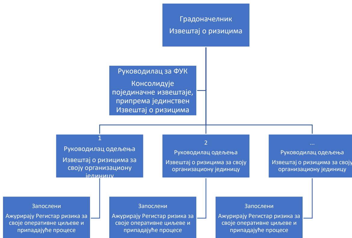
Слика 2. Шематски приказ процеса извештавања о ризицима Града Крушевца

Шематски приказ система извештавања о ризицима Града Крушевца дат је у наставку.