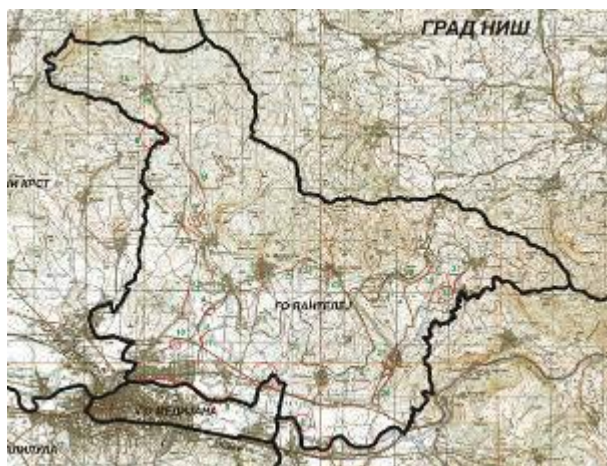
Слика 1: Положај Града Ниша у Републици Србији

Површина Градске општине Пантелеј износи 14.176 , 36 и 62 м 2 , а број становника, по најсвежијим подацима Завода за статистику у Нишу из 2021. године је 52 209.