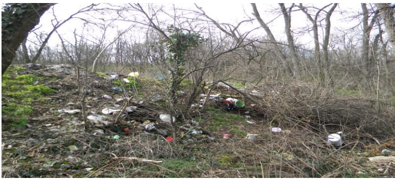
Слика 1. Парк -шумице Бубањ

Уређење парка – шумице Бубањ има за циљ унапређење и очување животне средине, репрезентативнијег изгледа града. За почетак је планирано уклањање дивљих депонија, сеча и уклањање самониклог растинја, болесних и сувих садница по ободу шуме уз улицу Бубањски хероји до “Специјалне школе” и уз улицу Војводе Путника у површини од око 9.250м 2 (дужина улице x 10 м од улице по дубини шуме).